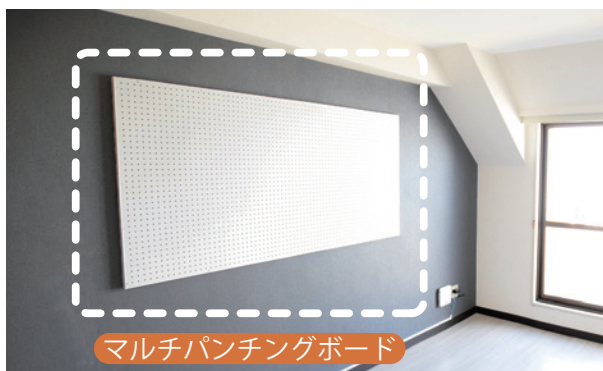
マルチパンチングボード

オリバーでは空室を解消する100の手法を準備し、市場や状況に応じた組み合わせで空室を改善する提案により、オーナー様の収益の維持・向上を図ります。