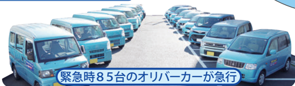
緊急時85台のオリバーカーが急行