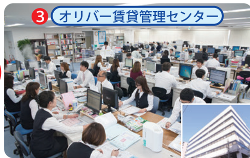
3 オリバー賃貸管理センター