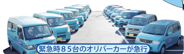
緊急時85台のオリバーカーが急行