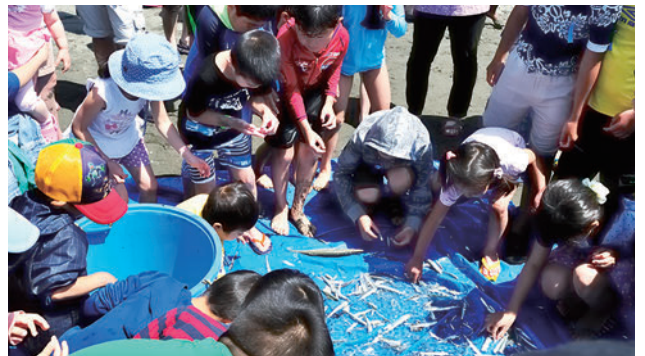
沢山とれたらお土産としてお持ち帰りも