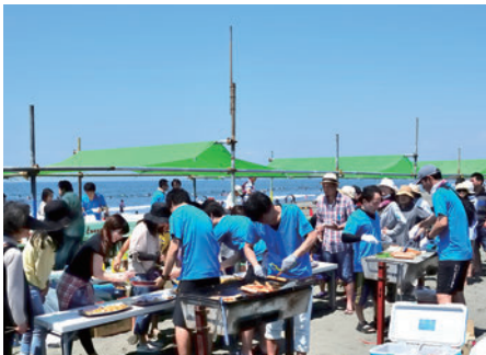
お食事は浜辺でバーベキュー