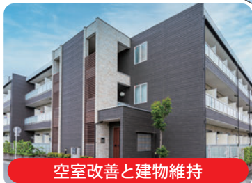
空室改善と建物維持