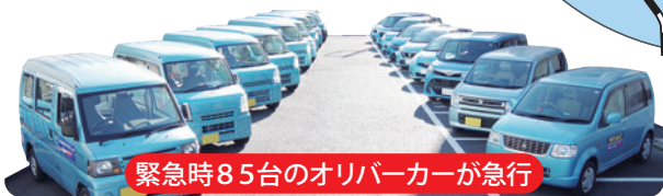
緊急時85台のオリバーカーが急行