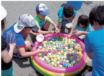
お子様からお楽しみいただけるゲーム