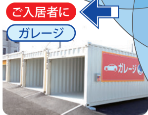
ご入居者に ガレージ