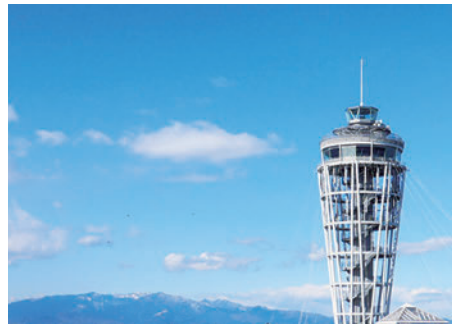
江の島展望灯台チケットプレゼント