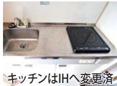
キッチンがIHへ変更済