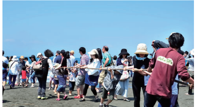
ご参加者様全員で力を合わせて網をひきます