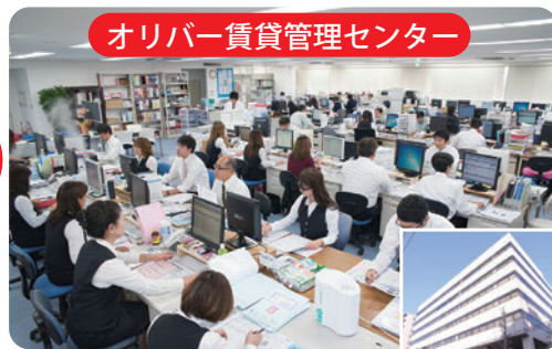
オリバー賃貸管理センター