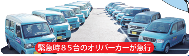
緊急時85台のオリバーカーが急行