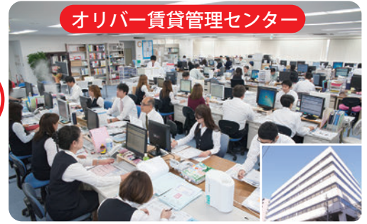
オリバー賃貸管理センター

[会社概要] 設立 1982年5月 グループ資本金 8,000万円 社員総数 200名