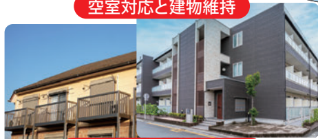
空室対応と建物維持