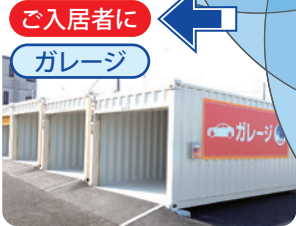
ご入居者に ガレージ