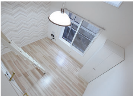
駅近くで内装も綺麗なご購入物件

元々不動産に興味があり、宅建士の資格を取得し大家さんのコミュニティに入会して勉強会に参加していました。そこでの交流が刺激になり、具体的に物件探しを始めるきっかけになりました。当初は、希望に合う物件が見つからず、探すエリアを広げたことでオリバー