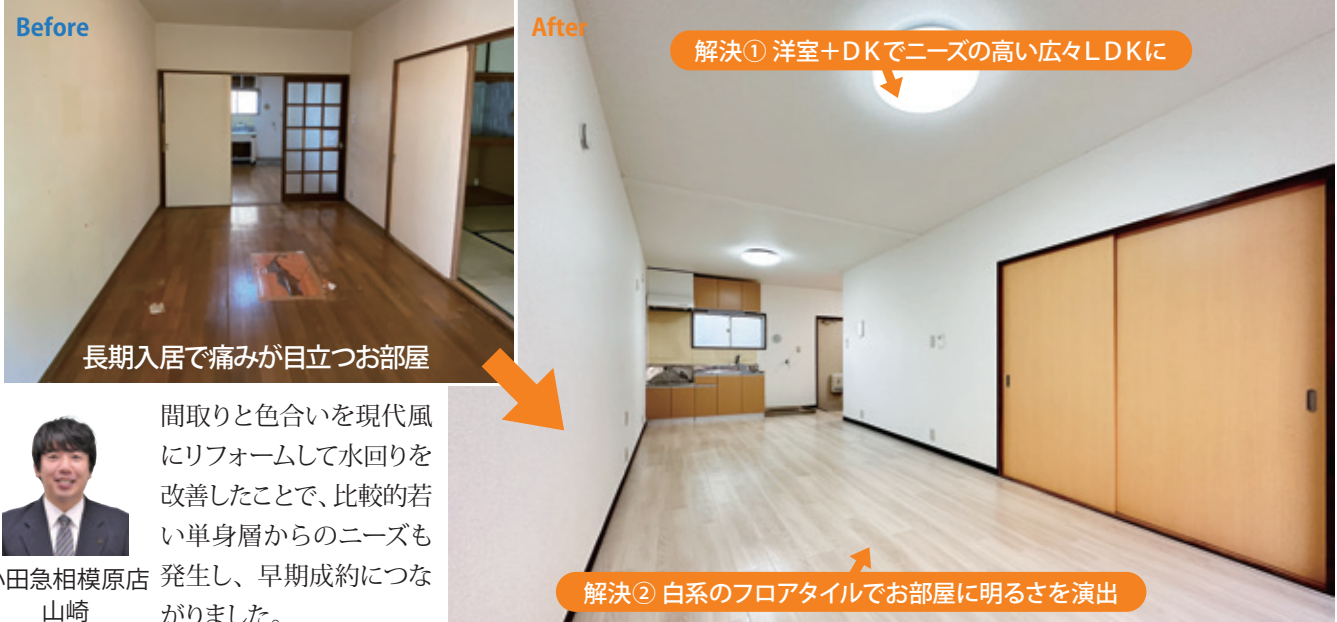
長期入居で痛みが目立つお部屋