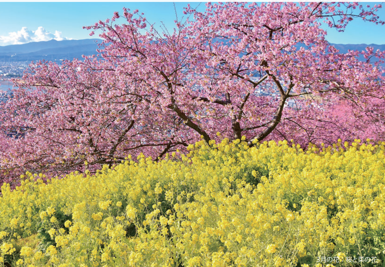
3月の花：桜と菜の花