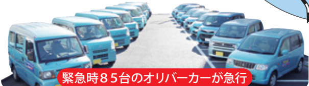
緊急時85台のオリバーカーが急行