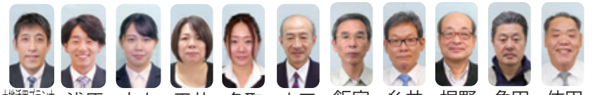
土肥原 清水 [群馬県]