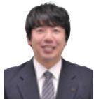
小田急相模原店 山崎

間取りと色合いを現代風 にリフォームして水回りを 改善したことで、比較的若 い单身層からのニーズも 発生し、早期成約につな がりました。