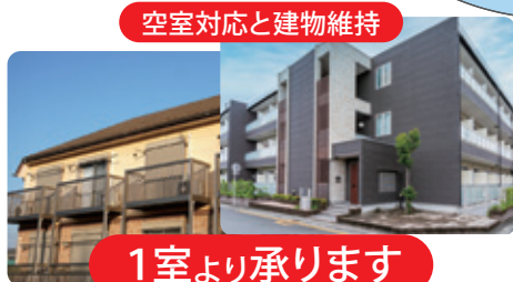
空室対応と建物維持