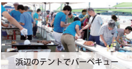
浜辺のテントでバーベキュー

今年もたくさんのオーナー様にご参加いただき楽しんでいただけるよう、新しい企画と合わせて今から準備を進めております。ご家族・ご友人とお誘い合わせのうえ是非ご参加ください。