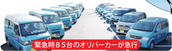
緊急時85台のオリバーカーが急行