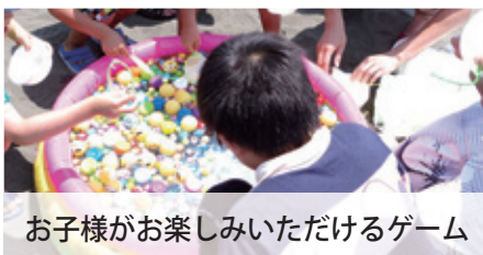
お子様がお楽しみいただけるゲーム