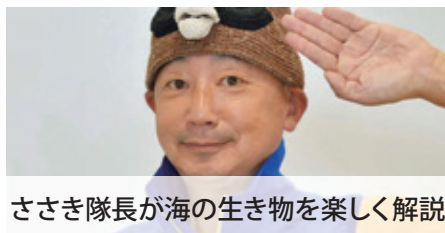
ささき隊長が海の生き物を楽しく解説