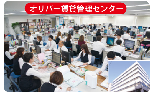
オリバー賃貸管理センター