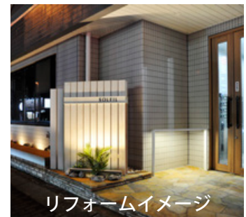
リフォームイメージ

ーズに応え、リノベーション（再生改修）で付加価値を加え、物件の魅力と価値を維持・増進する空室対策が一層重要になります。今後のポイントは早めに対策を実行に移すことも重要です。