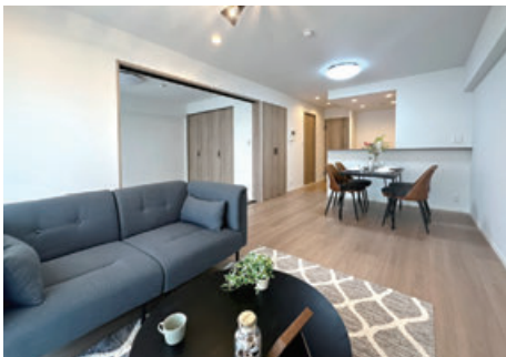
新築と見紛うフルリフォームのお部屋

前の住まいは賃貸で、新築で広さもあったので家賃はそこそこしましたから、ローンが組めるなら購入したいと考えました。これまでの賃貸が新築で、自然と購入も新築と思っていましたが、希望する物件は見つかりませんでした。そんな時、オリバーさんのチラシがポストに入り、中古マンションでしたが近く