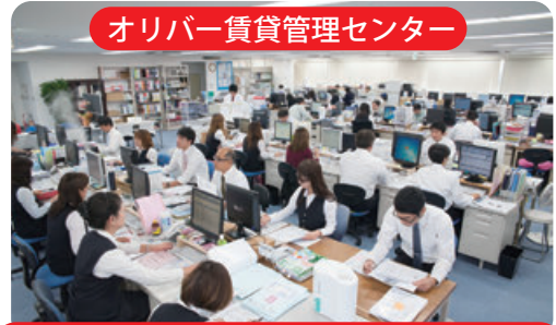
オリバー賃貸管理センター 宅建士60名・賃貸経営管理士29名

[会社概要] 設立 1982年5月 グループ資本金 8,000万円 社員総数 200名