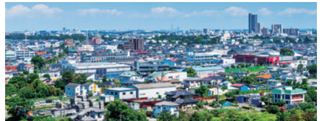
再開発で相模原の街も様変わりしてきます

2026年の地価公示からは、不動産市場が新たな転換期を迎えていることが分かります。物件ごとの状況を見極め、早めに対策を打つことが重要です。私たち管理会社は、オーナー様の経営パートナーとして、市場の変化を的確に捉え、賃貸経営の安定と発展を全力でサポートいたします。ご所有物件の賃貸経営戦略や今後の方向性について、ぜひご相談ください。